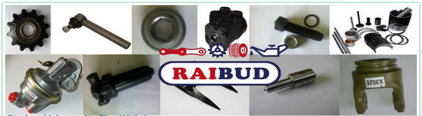
Strohzerkleinerer für Biso Häcksler