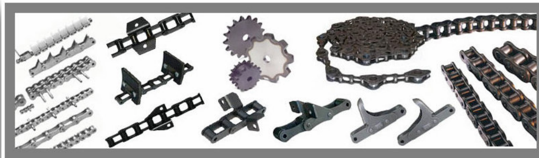
Kette 208B John Deere