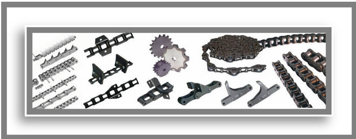
Kette 208B John Deere