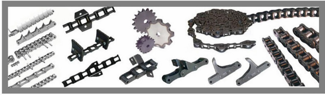
Kette 208A 2040